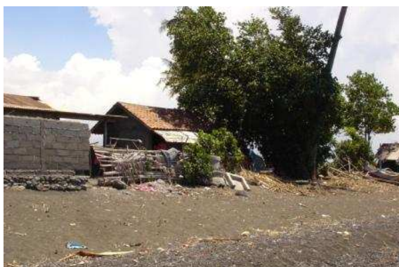
huisje op het strand, de zee heeft vrij spel

Afgelopen oktober was Trudy op bezoek geweest bij een gezin dat op het strand van Lovina in een bamboehutje woonde en pech op pech ook nog een gehandicapt kind hebben. Doordat ze op het strand wonen moeten zij tijdens het regenseizoen telkens een ander onderkomen zoeken omdat de zee dan veel hoger staat met alle gevolgen vandien.