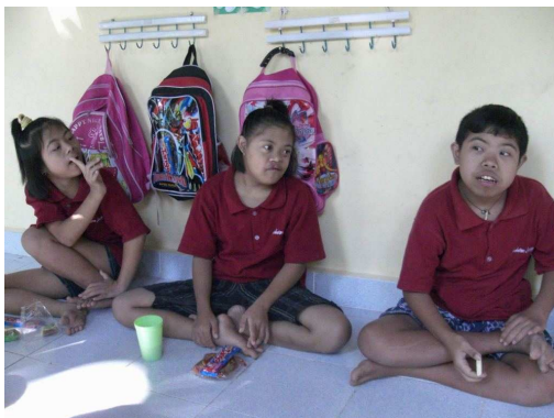
Kinderen Jembatan Senang