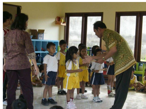
Felicitaties voor beste leerlingen Bugbug

Ook de drie beste van elk van de drie groepen in de kleuterschool kreeg een hand en presentje van het hoofd van de school.