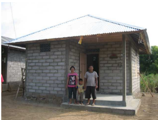
voorbeeld van Rumah Baik huisje