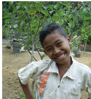
Boneng, 11 jaar